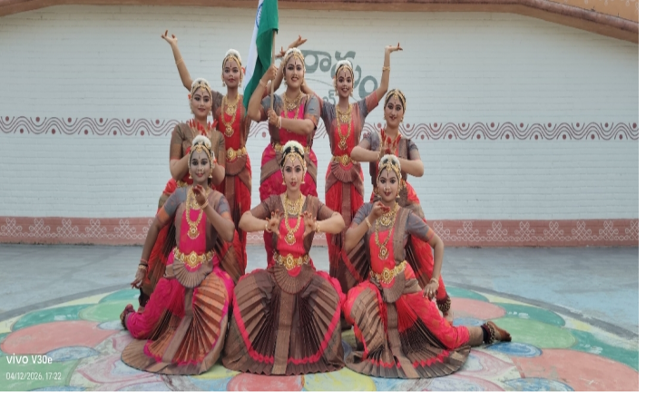
అలరించిన కర్ణాటక గాత్ర కచేరి భరతనాట్యం