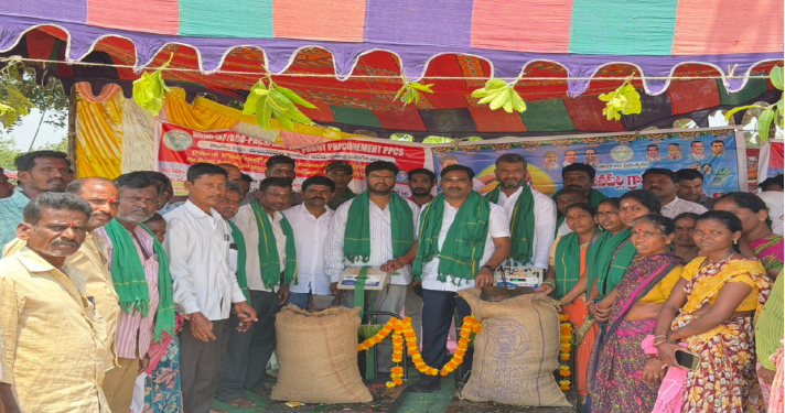
మన ప్రజాశక్తి ఆలేరు మండలం ఏప్రిల్ 12, 2026

యాదాద్రి భువనగిరి జిల్లా ఆలేరు మండలం, గోలనుకొండ, కొల్లూరు, మండనపల్లి గ్రామాల్లో అదేవిధంగా ఆలేరు పట్టణంలోని మార్కెట్ యార్డులో వరి ధాన్యం కొనుగోలు కేంద్రాలను తెలంగాణ రాష్ట్ర ప్రభుత్వ విప్ ఆలేరు ఎమ్మెల్యే బీర్ల అయిలయ్య ప్రారంభించారు ఈ సందర్భంగా ఆయన మాట్లాడుతూ రైతుల సంక్షేమమే రాష్ట్ర ప్రభుత్వ ముఖ్య ధ్యేయమని తెలిపారు. రైతులు పండించిన వరి ధాన్యాన్ని సరైన ధరకు కొనుగోలు చేయడానికి ప్రభుత్వం ప్రత్యేక చర్యలు చేపట్టిందని చెప్పారు. కనీస మద్దతు ధర ఎం. ఎస్.పి ప్రకారం ధాన్యాన్ని కొనుగోలు చేస్తూ రైతులకు న్యాయం చేస్తుందని తెలిపారు. మధ్యవర్తులు లేకుండా నేరుగా రైతుల నుంచే ధాన్యం సేకరించే విధానాన్ని అమలు చేస్తున్నామని పేర్కొన్నారు. అలాగే