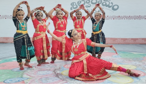
మేడ్చల్ జిల్లా పత్తినిది, ఉప్పల్, మే 31, మన ప్రజాశక్తి :

ఉప్పల్ మినీ శిల్పారామం లో వారాంతపు సాంస్కృతిక కార్యక్రమాలలో భాగంగా ఆదివారం గురువు మేఘన