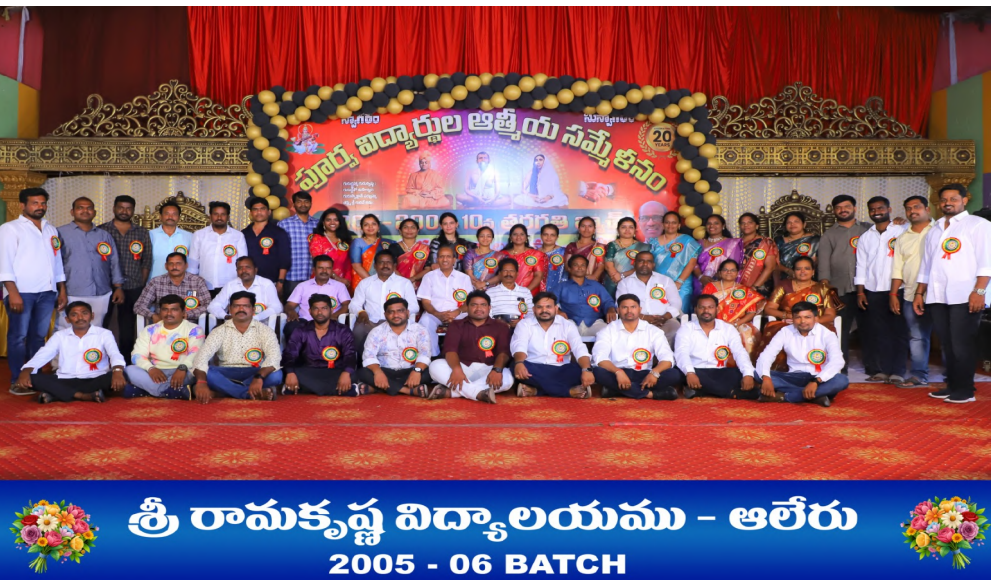
శ్రీ రామకృష్ణ విద్యాలయం - ఆలేరు 2005 - 06 BATCH

గత కాలపు తీవ్ర జ్ఞాపకాలను నెమరువేసుకుంటూ, చదువుకున్న పాఠశాలను, తమకు విద్యార్థులు నేర్పిన గురువులను గౌరవించుకుంటూ శ్రీ రామకృష్ణ విద్యాలయం 2005--2006 ఎస్ఎస్సీ బ్యాచ్ పూర్వ విద్యార్థుల ఆత్మీయ సమ్మేళనం ఆదివారం స్థానిక