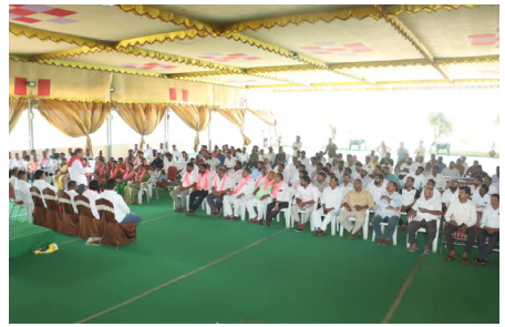
మరింత పెంచేందుకు సభ్యత్వ సమోదాన కార్యక్రమం కీలకమని పేర్కొన్నారు. ఈ కార్యక్రమంలో బి ఆర్ ఎస్ పార్టీ నాయకులు కార్యక్రమాలను తదితరాలు పాల్గొన్నారు.