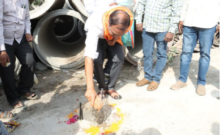
రూ.40 లక్షలసాకేట్ కాలనీలో ఓపెన్ జీవీ చిన్నారుల ఆట పరికరాల ఏర్పాటు, రూ.25 లక్షలహోల్ ఎన్ క్లీవ్ లో సీసీ రోడ్ల నిర్మాణ పనులు, రూ.60 లక్షలకాప్రా నాలా నుండి సాయి సుమా టీ-జంక్షన్ వరకు స్టాల్స్ వాటర్ డ్రెయిన్ నిర్మాణ పనులు రూ.2.50 కోట్లగాంధీనగర్ లో సీసీ రోడ్ల నిర్మాణ పనులు, రూ.20 లక్షలమొత్తంగా సుమారు రూ.4 కోట్ల వ్యయంతో చేపడుతున్న ఈ