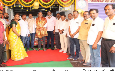
మరిన్ని రావాలని ఆకాంక్షించారు. వ్యాపార రంగంలో అడుగు పెడుతున్న యువ పారిశ్రామిక వేత్తలను ప్రోత్సహించడం సమాజ అభివృద్ధికి దోహద పడుతుందని పేర్కొన్నారు. అను ఫుడ్ కోర్ట్ వెజ్ నాన్-వెజ్ వంటకాలతో పాటు టిఫిన్స్, మీట్స్,