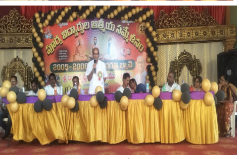
20 ఏళ్ల తర్వాత ఒకే వేదికపైకి చేరిన విద్యార్థిని, విద్యార్థులు